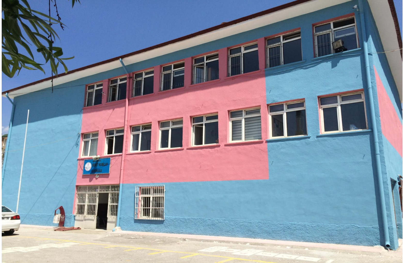
ŞEHİT KUBILAY İLKOKULU